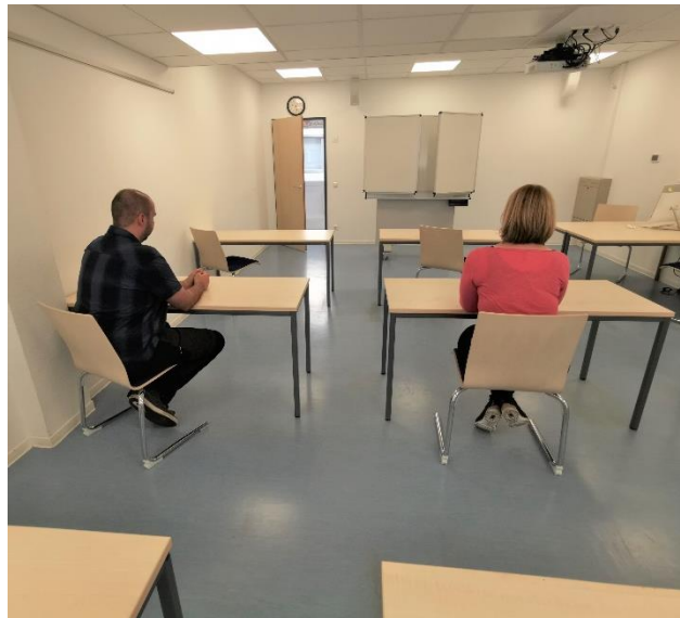
- ein Mindestabstand von 1,5 m