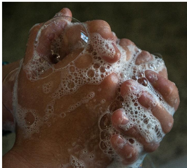
- gründliches Händewaschen