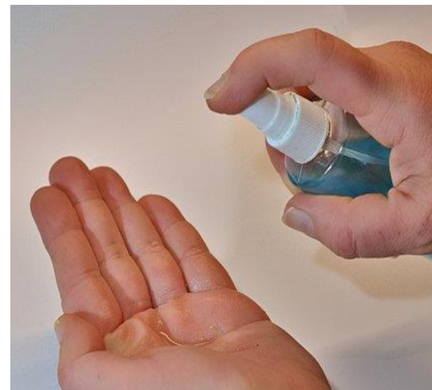
- Hände desinfizieren