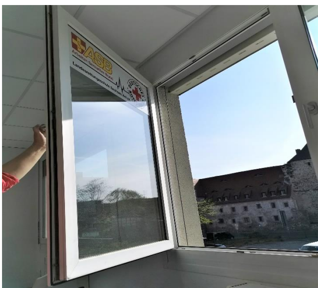
- regelmäßiges Lüften